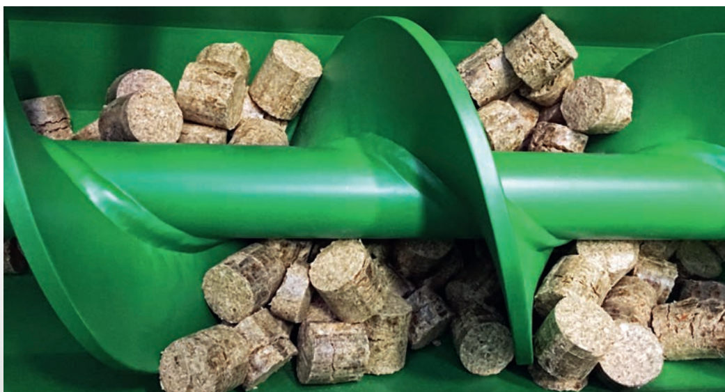
Vis de transport avec briquettes de la presse Briklet

Sous réserve de modifications techniques – débit selon la matière première